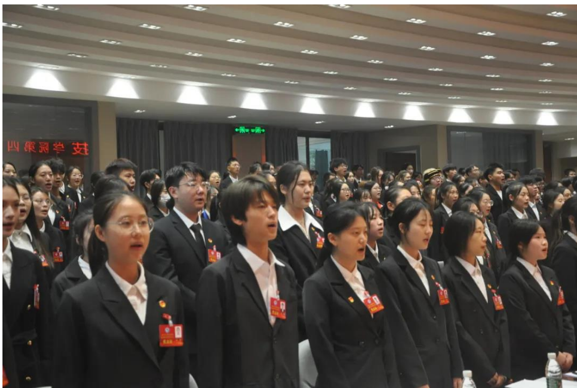
代表们齐唱《光荣啊，中国共青团》